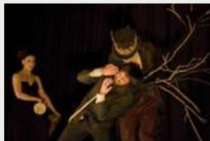
"EL ÁRBOL DE HIROSHIMA" (2016)