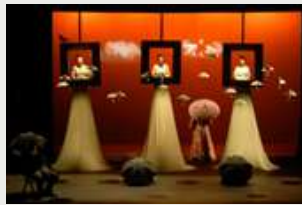
"DECIR LLUVIA Y QUE LLUEVA" (2010)