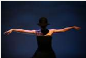
"PAISAJE CON ARGONAUTAS" (2008)

Hemos mostrado nuestros trabajos tanto en el País Vasco como fuera de él, habiendo pasado durante estos años por escenarios de España, Italia, Francia, Portugal, Brasil, Argentina o Estados Unidos donde, además de tomar parte en festivales de gran prestigio, hemos impartido cursos y conferencias, realizado demostraciones de trabajo y participado en distintas charlas y jornadas de investigación.