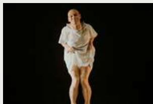
"EL ALIMENTO DE LAS MOSCAS" (2021)