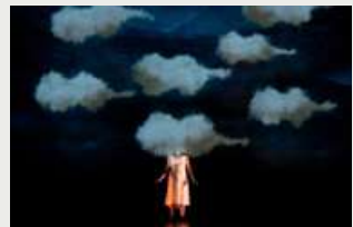
"ALICIA DESPUÉS DE ALICIA" (2017)