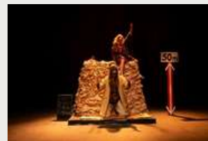
"EL SABOR DEL MELOCOTÓN" (2022)