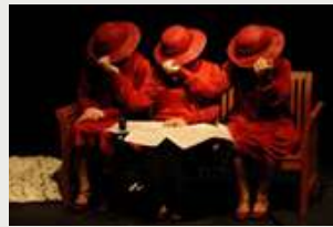
"ROJO AL AGUA" (2012)