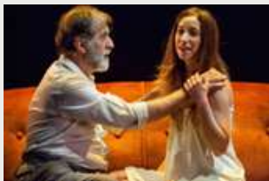
"LA NOCHE ÁRABE" (2015)